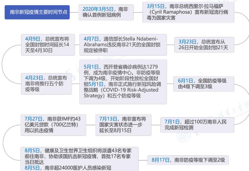
图2 南非新冠疫情相关重要事件和时间梳理