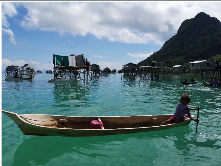
（海上巴瑶人）

作者们认为，海上游民如今松散且具有欺骗性的无政府组织形态与他们过去的辉煌形成了鲜明对比，这是与快节奏的现代性发生冲突之结果，而不是其磨练了几千年的海上游牧生活方式的缺陷。