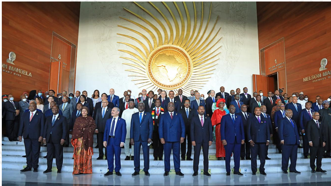
图 5：非洲联盟第 35 届峰会批准将斯瓦希里语设为非盟工作语言

月 7 日，解散二十余年的东共体重新成立，重新点燃了东非人民以斯瓦希里语为纽带，共同追求经济合作和区域一体化的精神。2022 年 2 月，在联合国 (UN) 和联合国教科文组织 (UNESCO) 的支持下，斯瓦希里语正式成为非洲联盟 (AU) 的官方工作语言。该举措旨在提高非洲大陆内部的交流和合作，加强非洲各国之间的联系，促进非洲总体团结。